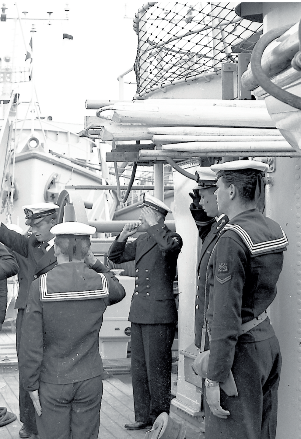
å hedre han med et minnesmerke. Etter krigen ble Onsrud politimester i Arendal. Sørlandske