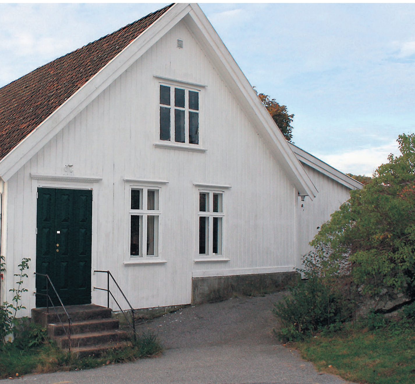
avholdsforeningens forsamlingshus og ble omgjort til midlertidig lasarett for de skadde tyske soldatene.