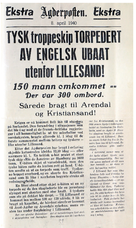
Agderpostens flyveblad, 8. april 1940, varslet om torpederingen utenfor Lillesand.