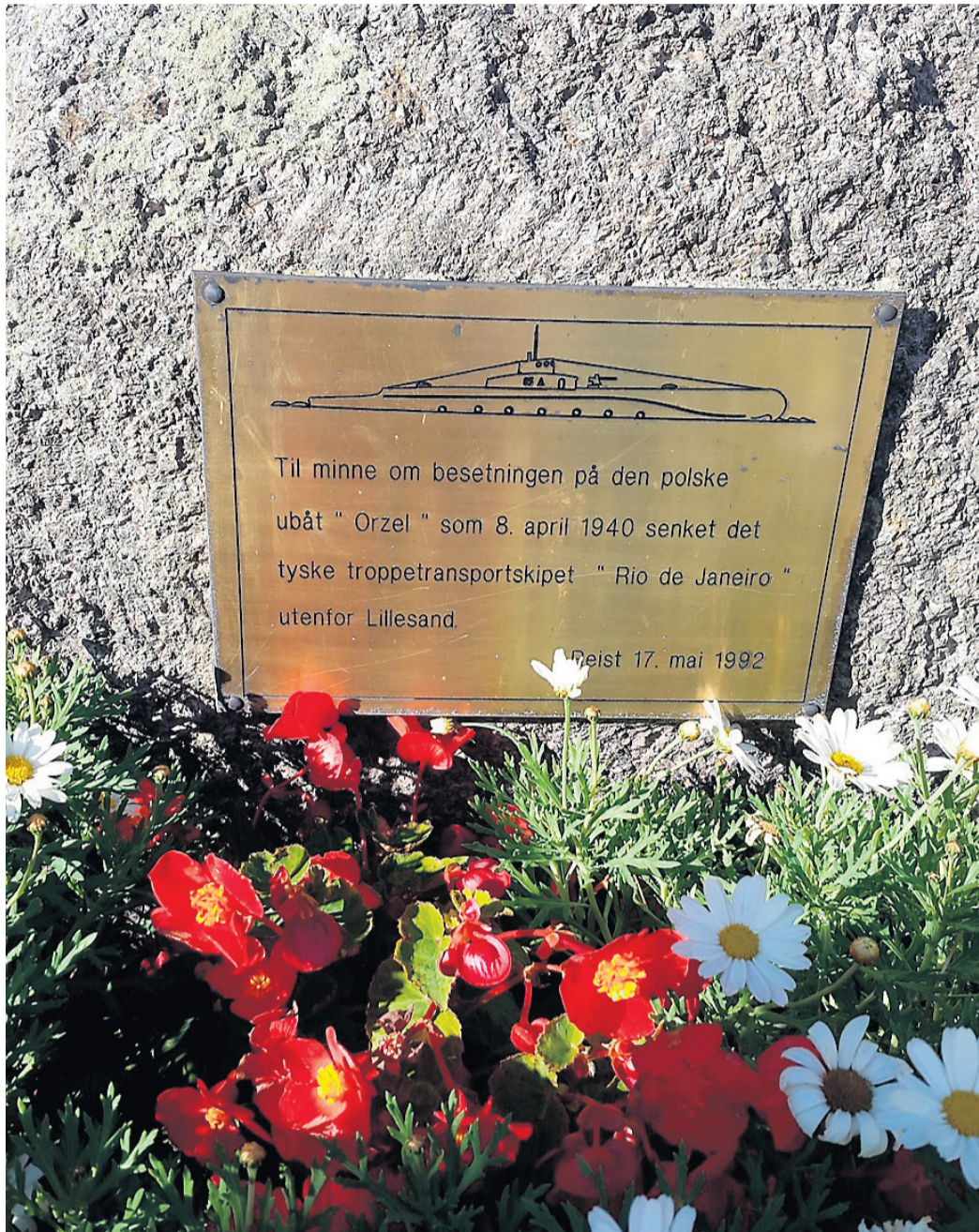
Det finnes et minnesmerke i Lillesand med tilknytning til torpederingen av «Rio de Janeiro». I 1993 ble det satt opp en minnestein over den polske ubåten «Orzel» utenfor byens rådhus.