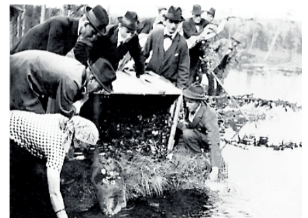
Norsk bever blir sleppt fri i Harrsjöån.

lukta kunne sive ut. Dersom ein var plaga med orm i børseløpet, skulle det hjelpe å stryke munningen på våpenet med bevergjel. Det kunne også jage bort sjøorm.