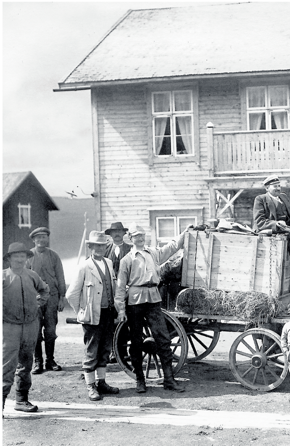
Den første beverutsettinga i Bjurälvdalen i Sverige i juni 1922.

Men sjølv om skinnnet var ettertrakta, var det ein annan del av beveren