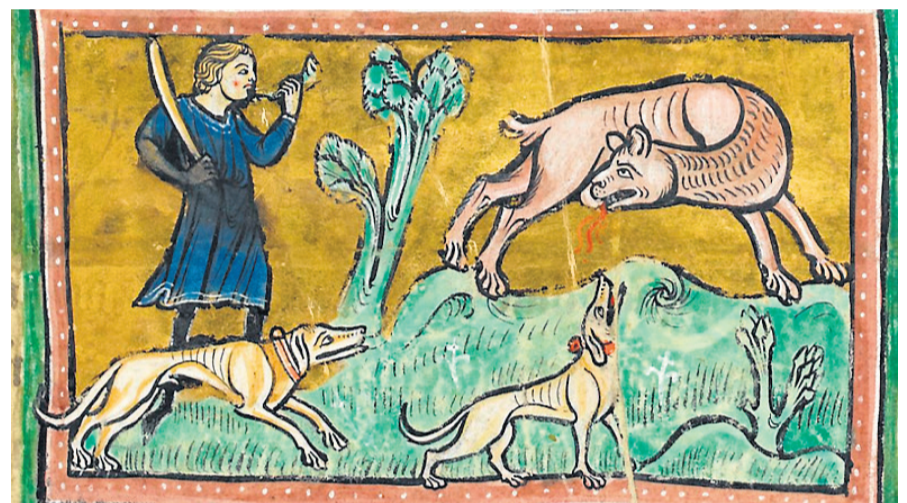
Illustrasjon frå eit engelsk manuskript frå byrjinga av 1200-talet som førestiller ein bever som bit av seg sine edle delar for å berge livet.