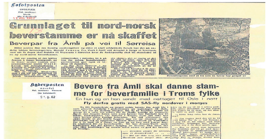
Faksimile av div. avisartiklar om utsetting av bever.

Det har vore knytt mykje overtru til bevergjel, og stoffet inngår i fleire formlar i svartebøkene frå mellomalderen. Spesielt effektivt skulle bevergjel vere mot orm i alle variantar. Nokre stader meinte ein at bevergjel kunne verne mot hoggorm, og ein la det inn i sylvknappar med hol slik at