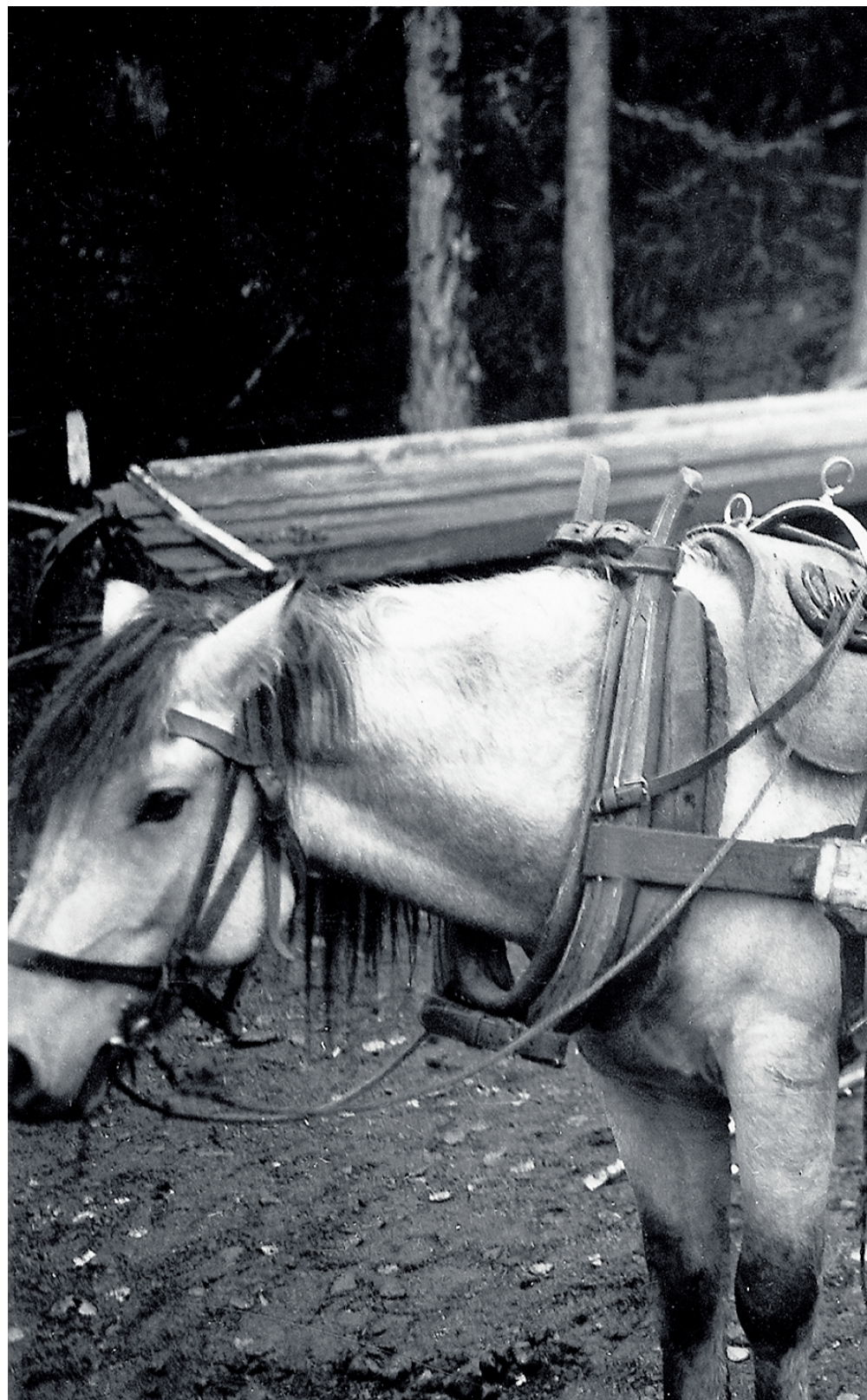
Tre norske beverar blir frakta til Bäverbäcken i Mörsil i 1934 for utsetting.

To naboar på Tveit i Åmli blei nøkkelpersonar i den første utførsel av bever