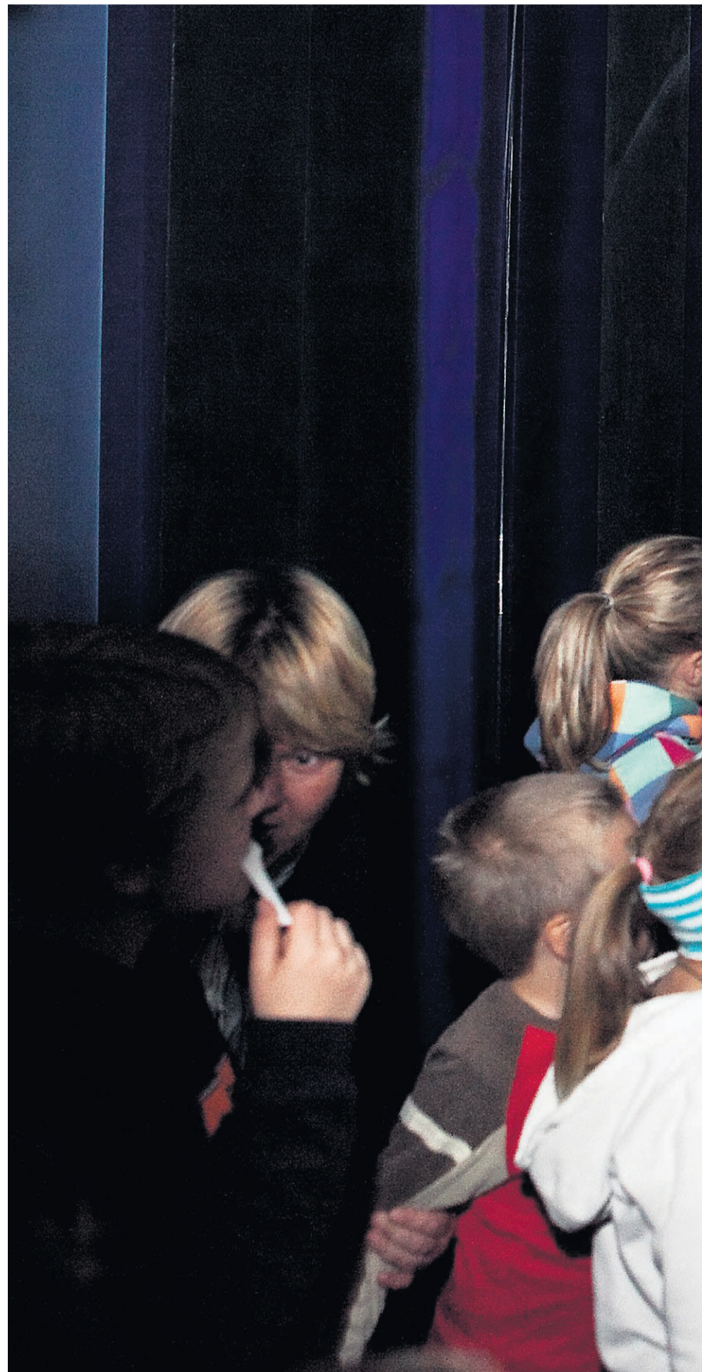
VÅKNER TIL LIV: En gallionsfigur våknet til liv da Aust-Agder kulturhistoriske senter – nå

Bakgrunnen for museumsfenomenet er åpenbart filmens ideoende kvaliteter. Men det faktum at så mange museer lager arrangementer som leker med ideen om gjenstandssamlingenes yrende natteliv, og at folk går mann av huse for å være med, antyder at det også kan være en dypere forbindelse mellom filmen og museer. Med andre ord berører filmen noe grunnleggende ved hva et museum er og oppfattes som. Dette er sannsynligvis noe av grunnlaget både for filmens suksess og de ettervirkningene den har fått i museumslandskapet. Det filmen satte på dagsorden – at det finnes noe mystisk og uutgrunnet ved museene, som først og fremst foregår når publikum vanligvis ikke får være til stede – er selvsagt også noe av grunnen til at museene lenge har vært en arena for popkulturell utfoldelse. Den meste kjente figuren som gjerne bruker museet som utgangspunkt for sine spennende eventyr, må være Donald Duck. I klassikeren «Gullhjelm» fra 1954, for eksempel, finner han i museets vikingskip et kart som viser veien til en sagnomsust gullhjelm.