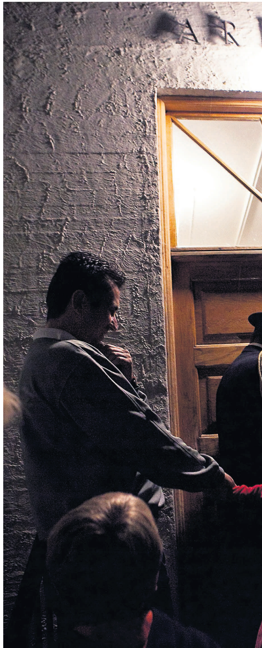
SPENNING: Spente barn lurer på hvilke overraskelser som venter dem på Natt på