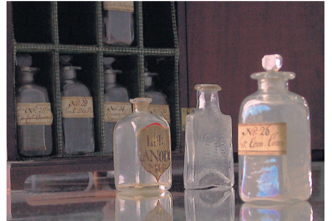
REISEAPOTEK: Dronning Caroline Mathildes reiseapoteket ble rikt utrustet, og medisinen var laget ved hoffapoteket i London. AAM.4905.