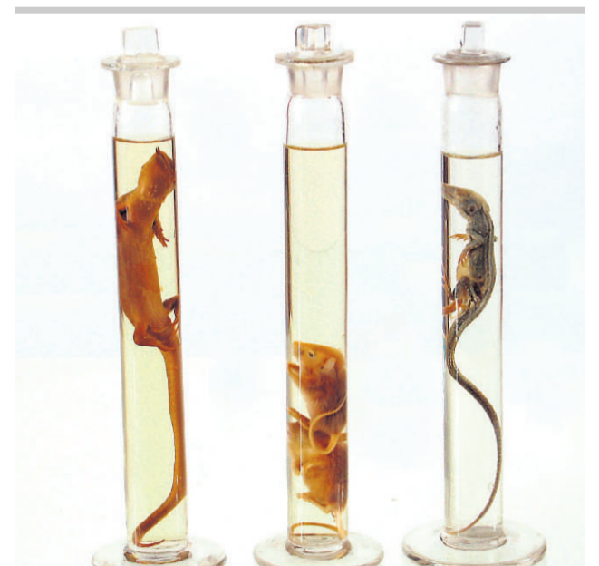
SKJULTE SKATTER: De underligste ting skjuler seg i museumsmagasinene på KUBEN.