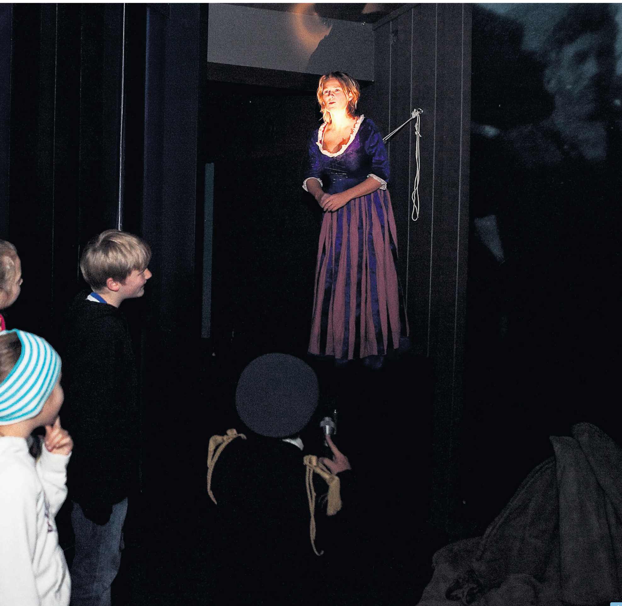
KUBEN – arrangerte Natt på museet i 2009.