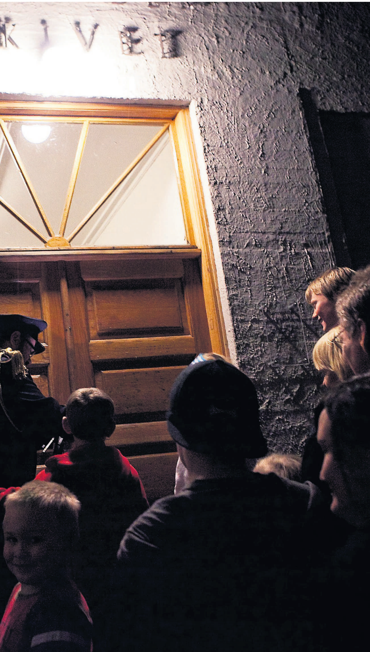
museet en mørk høstkveld på Langsæ i 2009.