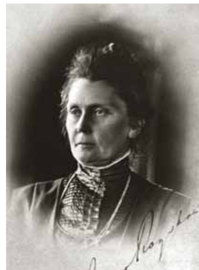
Anna Rogstad 1854-1938, første kvinne på Stortinget i 1911