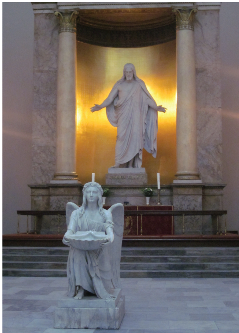
Den opstandne Kristus og Dåbens Engel ved alteret i Vor Frue Kirke i København.