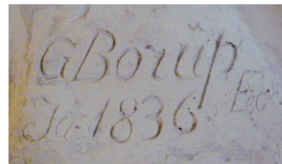
Signaturen til Gotthelf Borup er godt synlig på baksiden av både Kristus og Dåbens Engel.

Man kan lure på hvorfor Borup gjorde de små endringene som han gjorde. Han hadde tilgang på en kopi av marmorstatuen, den hadde stått i Vor Frue Kirke i mange år. Det var derfor fullt mulig å lage en