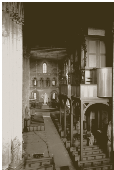
Eldre fotografi av Thorvaldsens Kristus som sto i Nidarosdomen til midten av 1960-tallet.

til Arendal i 1836 står på denne listen som er gjengitt her. Det er to ting her som er interessant i forhold til opplysninger om «vår» statue. Det ene er at statuen er en del av den «godkjente» listen og det andre er statuen som samme år ble gitt til Nidarosdomen i Trondheim.