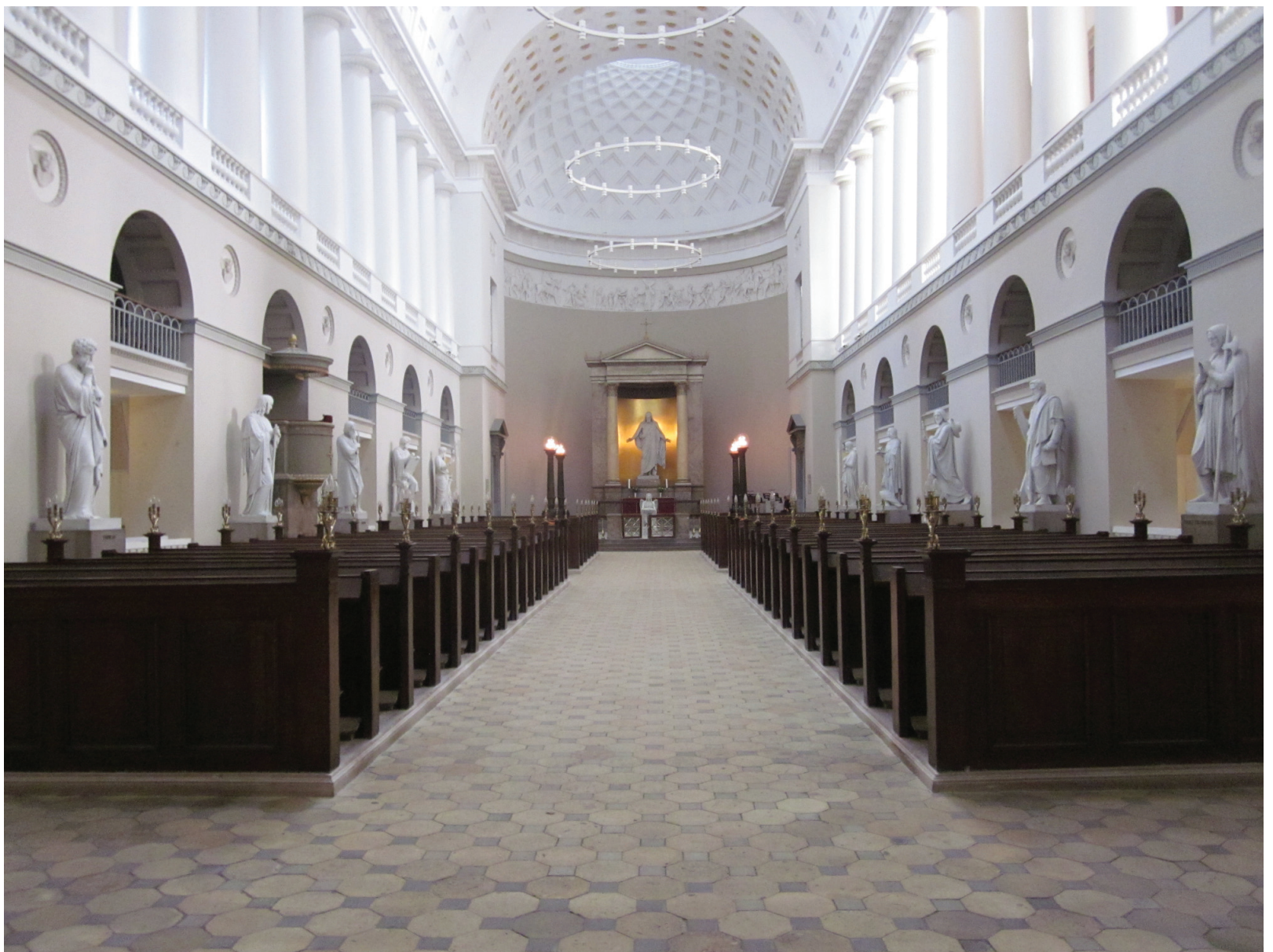
Kirkerommet i Vor Frue Kirke i København med Thorvaldsens skulpturer.

tors. How it would surprise you to see his great studio and his colossal works. He has lately made a statue of Christ. I have no doubt that this is by far the finest figure of Christ that has ever been executed by man – the simplicity, the majesty and the beauty of the head is beyond description.”