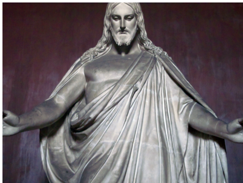
Når man begynner å nøyere studere AAKs sin statue og statuen i København er det små, men signifikante forskjeller som trer frem. En fold i kappen, hår som krøller seg på en annen måte, litt forskjell i vinkelen mellom haken og brystkassen. Øyepartiet er også forskjellig. Originalens blick er mer fokusert nedover enn AAKs sin statue som ser mer utover.