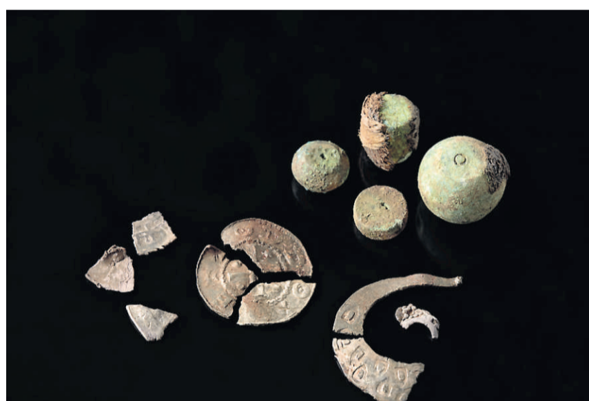
LITT AV HVERT: Tre myntfragmenter og ein komplett mynt i tre fragmenter, fragmentert sølvamulett, granulert sølvfragment og fire vektlodd.