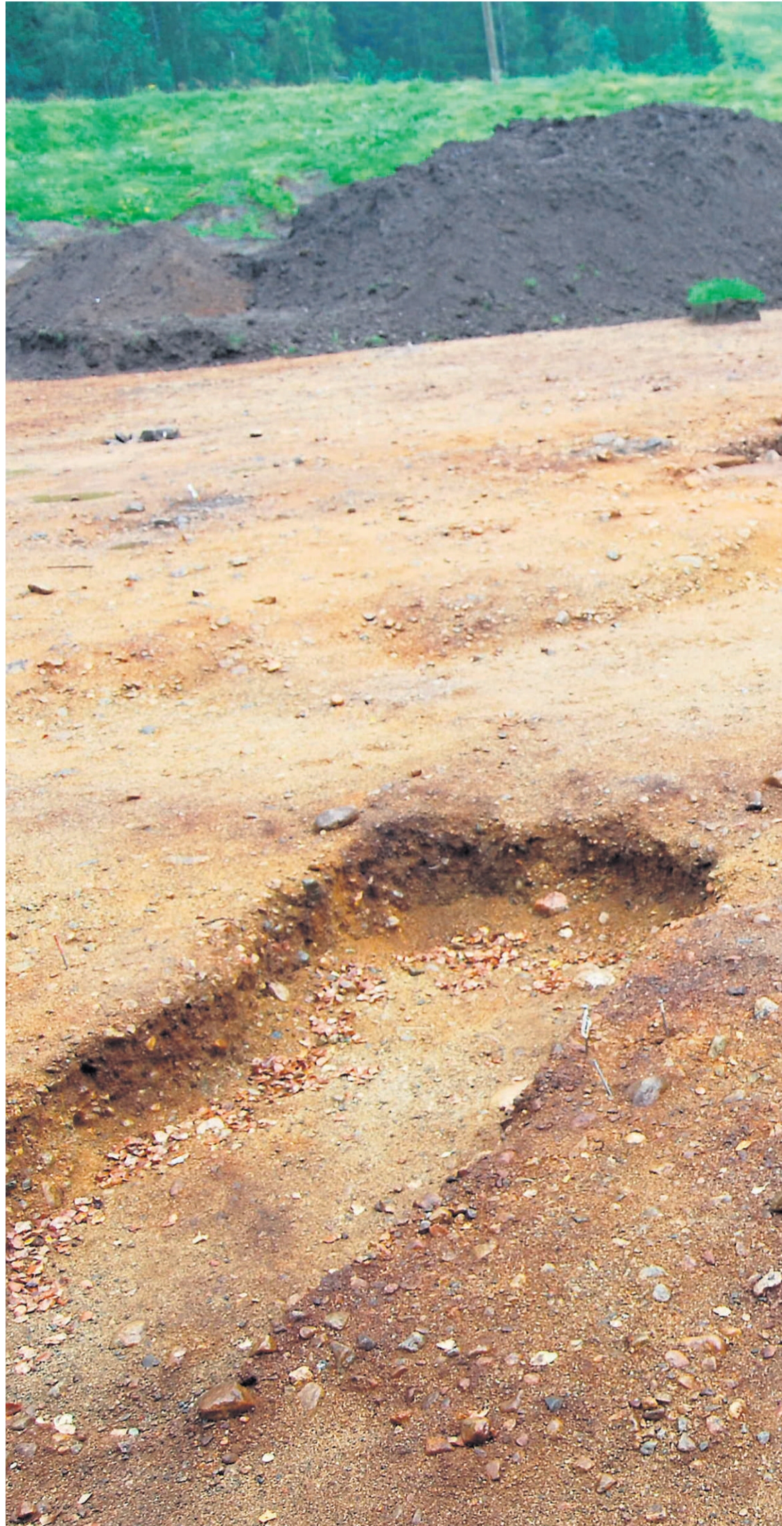
I FELT: Ferdig utgravne graver.

› Utstillinga er eit samarbeid mellom Aust-Agder museum og arkiv, Aust-Agder fylkeskommune og Kulturhistorisk museum i Oslo.