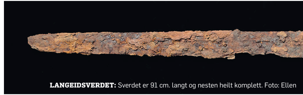
LANGEIDSVERDET: Sverdet er 91 cm. langt og nesten heilt komplett.