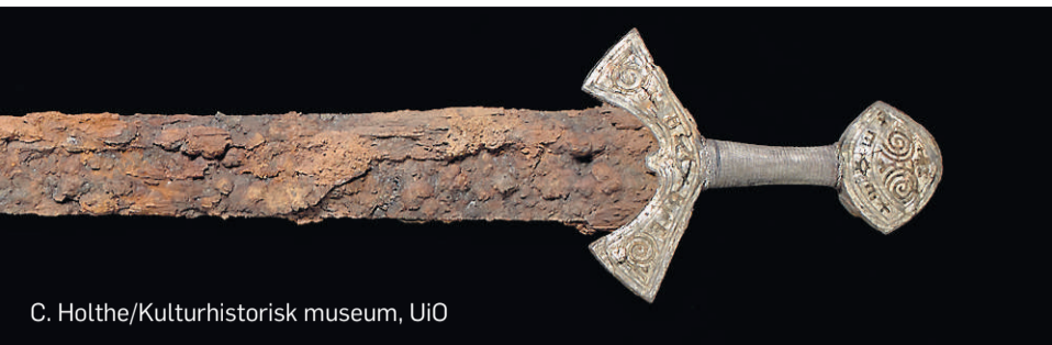
C. Holthe/Kulturhistorisk museum, UiO