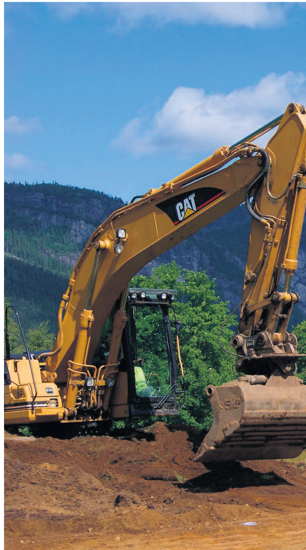
UTGRAVING: Med gravfeltet i bakgrunnen.

Ei av gravene belyser denne brytningstida godt. I grava blei det gjort nokre særse spennande funn. Det er eit sjeldan sverd, og eit av dei flottaste vikingsverda gjort i Noreg. Populært vart det kalla Langeidsverdet, og det var nesten heilt intakt med ei lenge på 91 cm. Då sverdet vart funne var det meste av overflata brun og dekkja av eit lag med rust. Røntgen av grepet viste at under laget med rust var det edle metall. Etter 400 timar med konservering vart hjaltet fri for rust og det viste seg å vere rikt dekorert med sølv, gull og koppar.