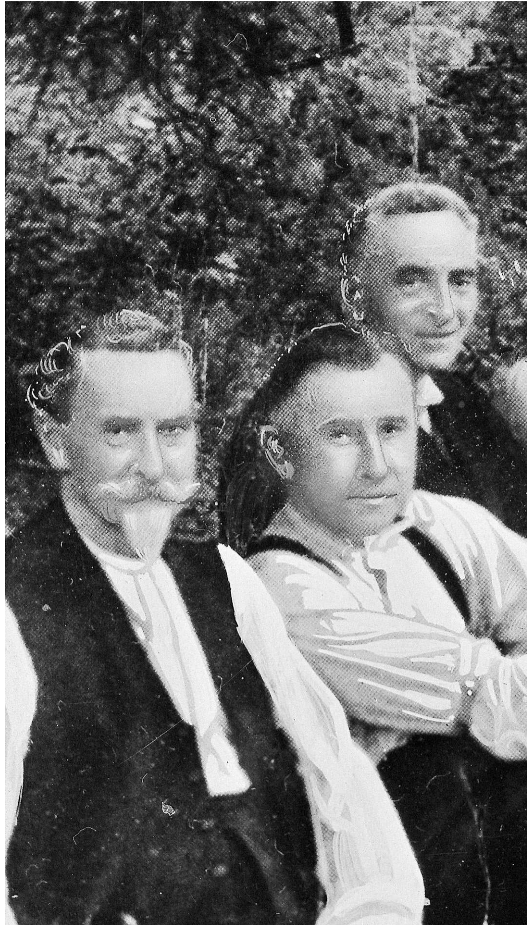
BISPESAMMENKOMST: Norske biskoper under en sammenkomst i Gudbrandsdalen sommeren 1942.